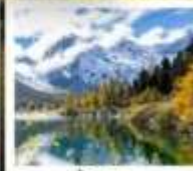
ปี้เพ็งโกว