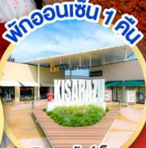
มิตซึย เอ้าท์เล็ต พาร์ค คิชะระชู