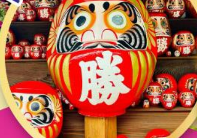
วัดคัตสึโฮจิ (วัดดามารุมะ)