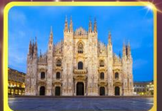
มหาวิหารแห่งเมืองมิลาน