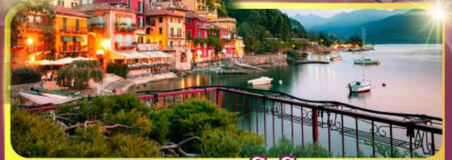
ทะเลสาบโตโบ

เดินทาง : 11-18 มิ.ย. 69 / 25 มิ.ย. - 02 ก.ค.69 02 - 09, 16-23 ก.ย.69 / 07 -14, 22-29 ต.ค.69 04 - 11, 11-18 พ.ย.69 25 พ.ย. - 02 ธ.ค.69 03 - 10, 23-30 ธ.ค.69 / 23 - 30 ธ.ค. 69 29 ธ.ค.69 - 05 ม.ค.70