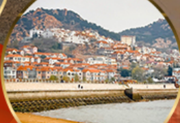
ซาจื่อเป่