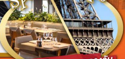
รับประทานอาหารกลางวัน บนหอไอเฟล

ไฮไลท์ในโปรแกรม • สะพานไม้ชาเปล ลูเซิร์น