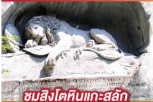
ชมสิงโตหินแกะสลัก