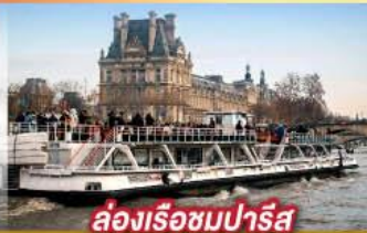
ล่องเรือชมปารีส