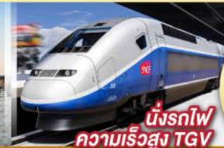
นั่งรถไฟ ความเร็วสูง TGV