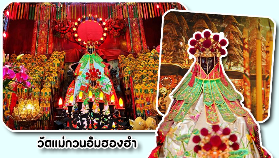
วัดแม่กวอนอิมสองฮำ

จากนั้นพาท่านเดินทางสู่ เมืองฮ่องกง พาท่านไปไหว้ขอพรองค์เจ้าแม่กวอนอิม ณ วัดแม่กวอนอิมสองฮำ วัดเก่าแก่ของฮ่องกงสร้างตั้งแต่ปี ค.ศ.1873 เป็นวัดขนาดเล็กที่มีชาวฮ่องกงศรัทธานับถือกันเป็นอย่างมากวัดแห่งนี้เป็นสถานที่ประดิษฐาน องค์เจ้าแม่กวอนอิมสองฮำ ที่มีชื่อเสียงเรื่องการให้ยืมเงินเชื่อกันว่าท่านช่วยพลิกฟื้นเศรษฐกิจของชาวฮ่องกง ผู้คนจึงนิยมมายืมเงินทำธุรกิจจนสำเร็จรำรวย รุ่งเรืองโดยให้ท่านอธิษฐานขอพรต่อหน้า เจ้าแม่กวอนอิมสองฮำพร้อมกับระบุวัน เวลาในการขอพรด้วย จากนั้นนำธูปบัตร์ตามฐานะและศรัทธาที่เราจะนำเป็นสื่อในการขอพร เขียนจำนวนเงินที่ต้องการลงไป ด้วย ใส่สกุลเงินย้งดีใหญ่ แล้วนำเงินใส่ในซองแดง ควรเตรียมซองแดงไปเอง นำซองแดงไปวนรอบกระถางรูป วนขวาจำนวน 3 ครั้ง แล้วเก็บซองแดงในกระเป๋าสตางค์เป็นเงินขวัญถุง ถ้าประสบความสำเร็จตามที่มุ่งหวังให้นำเงินในซองแดงทำบุญหยอดตู้ที่วัดแห่งนี้ในโอกาสต่อไป