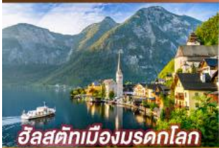
อัลสติกเมืองมรดกโลก