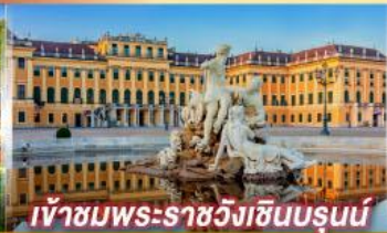
เข้าชมพระราชวังฮินบรุนน์