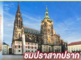
ชมปราสาทปราท