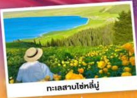
ทะเลสาบไซหลินู่