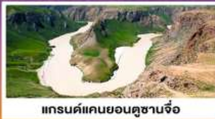
แกรนด์แคนยอนคูซานจื่อ