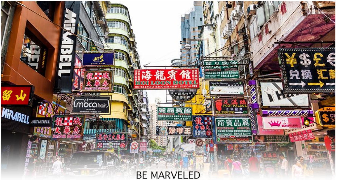
BE MARVELED MONGKOK

☉ อิสระอาหารอาหารเย็นตามอัธยาศัย **เพื่อความสะดวกในการช้อปปิ้ง**