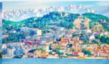
หมู่บ้านชาวประมงซาจื่อโซ่ว