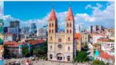
โบสถ์คริสต์เซนต์ไมเคิล

*ทางบริษัทฯ ขอสงวนสิทธิ์ในการสลับโปรแกรมทัวร์ตามความเหมาะสมขึ้นอยู่กับสถานการณ์หน้างาน โดยคำนึงถึงผลประโยชน์ของลูกค้าเป็นสำคัญ