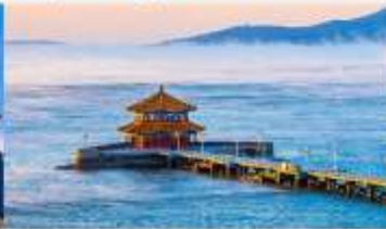
สะพานจันเจียว