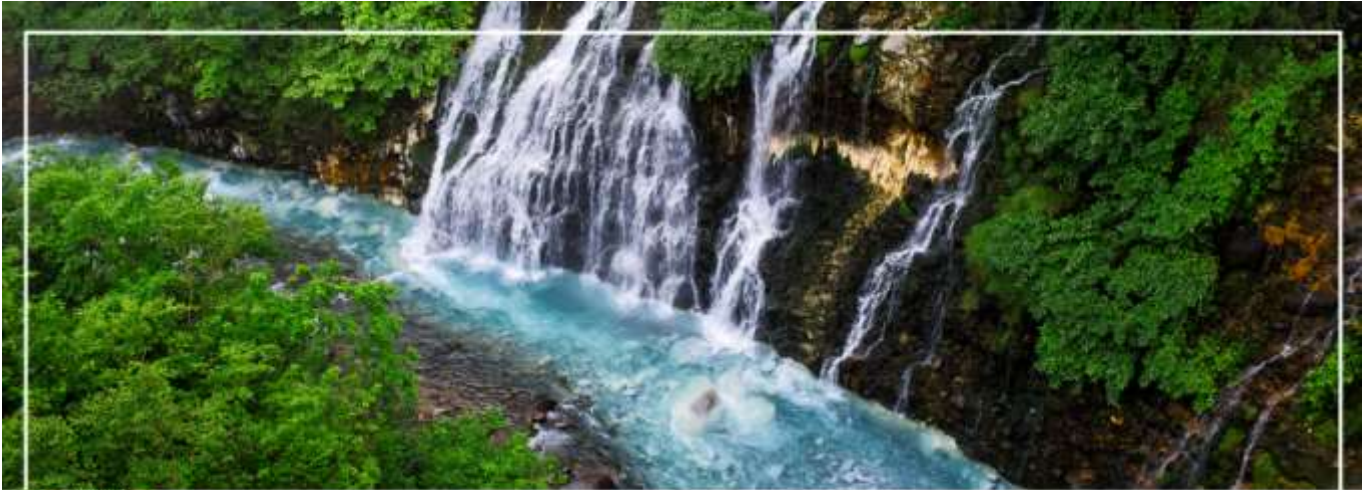
SHIRAHIGE WATERFALL น้ำตกชิราฮิเกะ

วันที่สอง ทำอากาศยานนิวซีโดเสะ สอกโกโด – เมืองบิเอะ – น้ำตกชิราฮิเกะ – สระอะโออิเคะ หรือ บ่อน้ำสีฟ้า – เมืองอาซาฮิดาวา – อีออน อาซาฮิดาวา