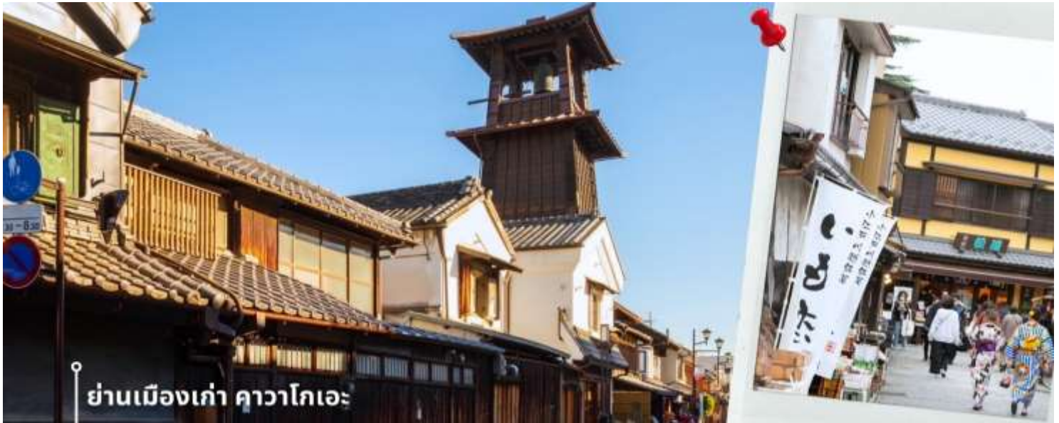
ย่านเมืองเก่า คาวาโกเอะ

08.00 น. เดินทางถึงสนามบินนาริตะ ประเทศญี่ปุ่น หลังจากผ่านพิธีตรวจคนเข้าเมืองและศุลกากรแล้ว นำท่านขึ้นรถโค้ชปรับอากาศ พาท่านเดินทางสู่ นำท่านเดินทางสู่ ย่านเมืองเก่าคาวาโกเอะ เมืองเก่าที่ได้รับสมญานามว่า “เอโดะน้อย” ด้วยความโดดเด่นของอาคารสไตล์แบบญี่ปุ่นดั้งเดิม ที่เรียงรายสองฝั่งถนนอย่างมีเสน่ห์ ราวกับได้ย้อนเวลากลับไปในยุคเอโดะ ใจกลางเมืองแห่งนี้คือ ถนนคุระซุคุริ Kurazukuri-dori ที่เต็มไปด้วยร้านค้าท้องถิ่น คาเฟ่ขนมหวาน และของฝากสไตล์ญี่ปุ่นโบราณ การเดินเล่นที่นี่ไม่ใช่แค่การเที่ยวชมสถาปัตยกรรม แต่ยังได้สัมผัสบรรยากาศที่เงียบสงบ มีเสน่ห์เฉพาะตัว เหมาะสำหรับการถ่ายรูปและเรียนรู้วัฒนธรรมญี่ปุ่นในแบบที่จับต้องได้ สัญลักษณ์สำคัญของเมืองคือ “หอรระซังโทคิโนะคาเนะ” (Toki no Kane) ที่ยังคงดังบอกเวลาวันละ 4 ครั้ง เป็นเสียงแห่งอดีตที่ยังสะท้อนอยู่ใน