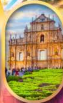
โบสถ์เซนต์พอล