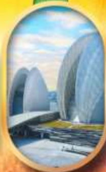
โรงละครไข่มุก