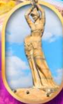
เด็กหญิงชาวประมง