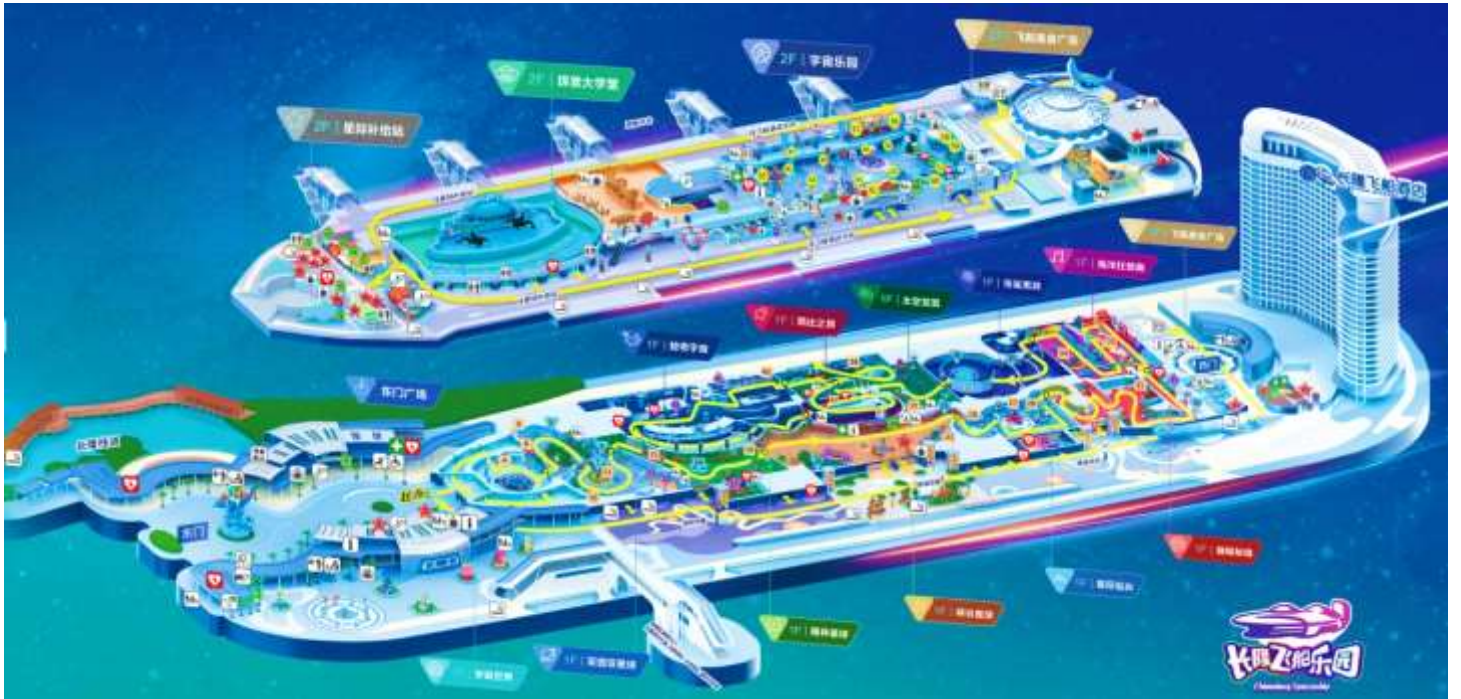
แผนที่ CHIMELONG SPACESHIP PARK