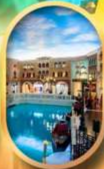
เดอะเวนิเซียน