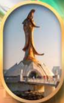
เจ้าแม่กวนอิมริมทะเล