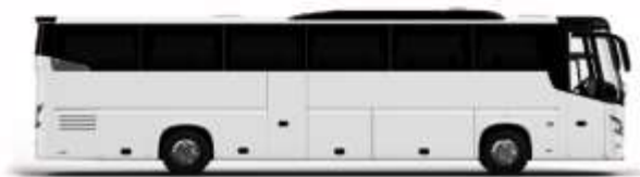
ตัวอย่างรูปภาพรถ 1 ชั้น

หากประเภทห้องที่ท่านริเควสมาเต็ม อาทิ เช่น ริเควสห้องพักเป็น TWIN BED หรือ DOUBLE BED ทางบริษัทของสวนสิทธ์ในการปรับประเภทห้องพัก เป็น ตามที่โรงแรมมีอยู่ โดยไม่ต้องแจ้งให้ทราบล่วงหน้า