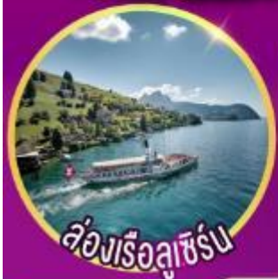
ห้องเรือลูซิเิร์น