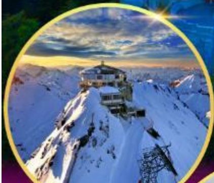
ยอดเขาซิลธอร์น