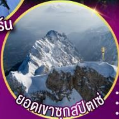
ยอดเขากุสปีตซ์