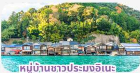
หมู่บ้านชาวประมงอินะ