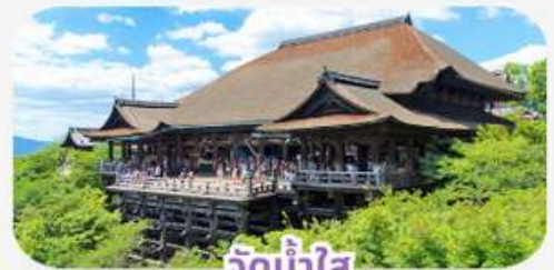
วัดน้ำใส