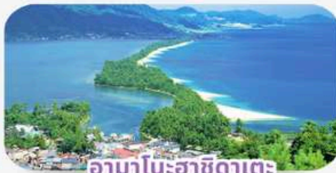
อามาโนะฮาซิดาเตะ