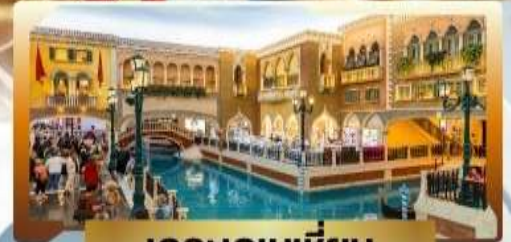
เดอะเวเนเชียน

4 วัน | 3 คืน | น้ำหนักกระเป๋า 23KG | พักโรงแรม 3 ดาว | บอนมาเก๊า 3 คืน