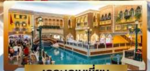
เดอะเวเนเซียน

4 วัน | 3 คืน | น้ำหนักกระเป๋า 23KG | พักโรงแรม 3 ดาว | นอนมาเก๊า 3 คืน