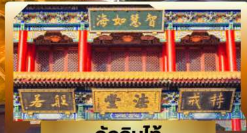
วัดจีนไท้