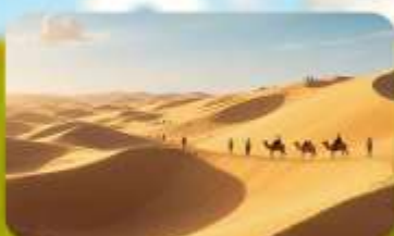
เนินทรายอินเคินทาลา