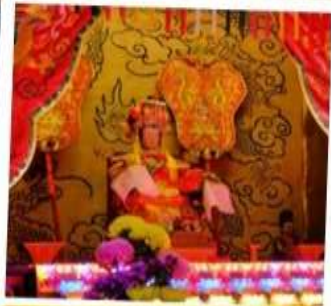
เจ้าแม่ทับทิม จอสเฮ้าส์เบย์