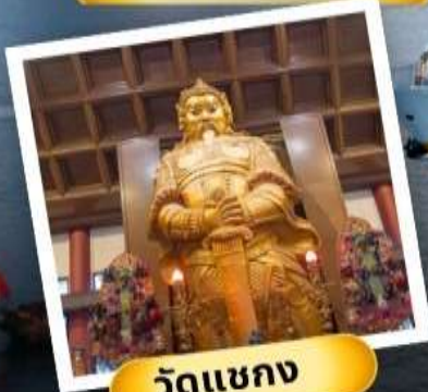
วัดเขากง