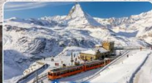
นั่งรถไฟสู่ยอดเขา กรอนเนอร์เกรต