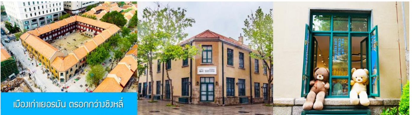
เมืองเก่าเยอรมัน ตรอกกว้างชิงหลี