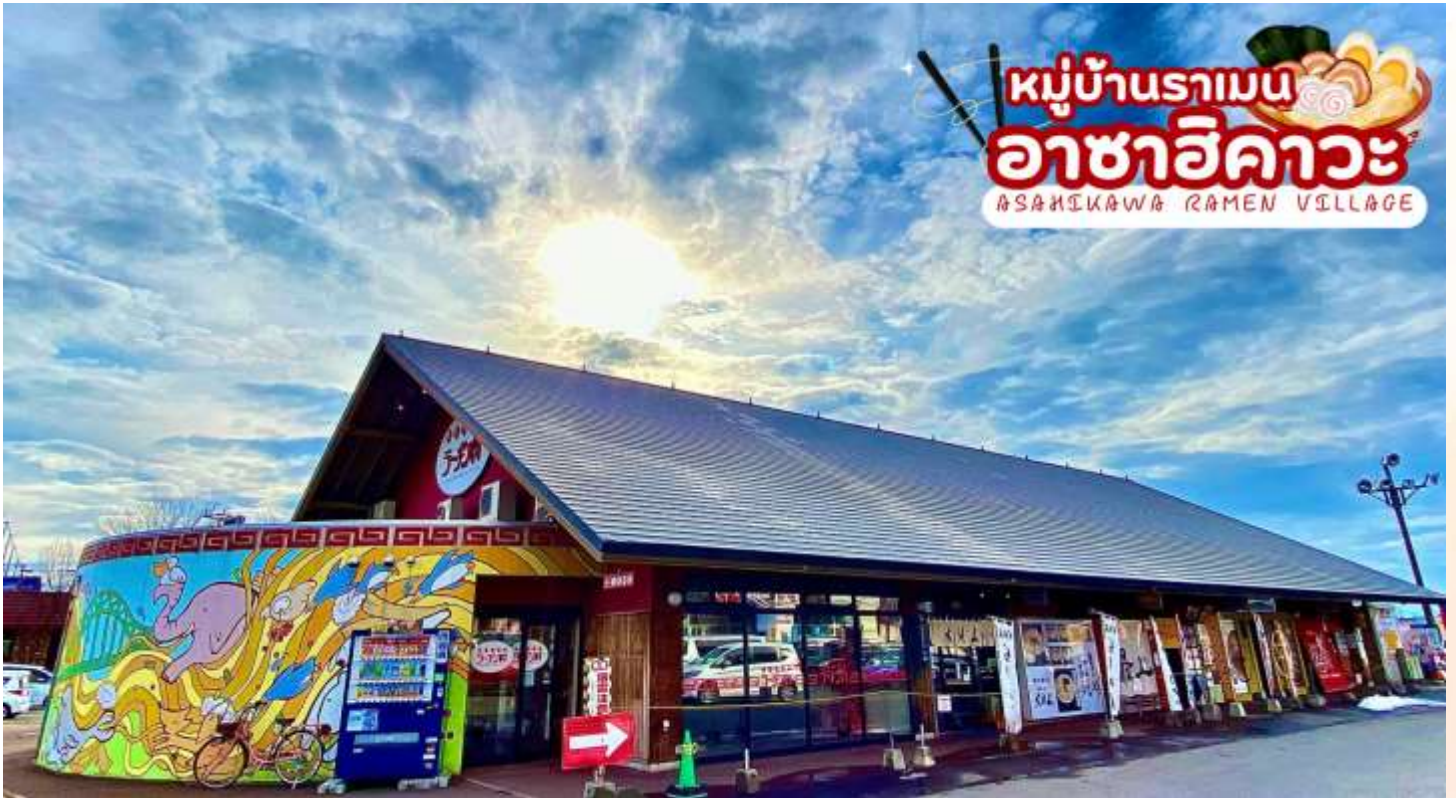
ร้านราเมน ที่แนะนำ

นำท่านเดินทางสู่ ราเมนต้นตำรับแท้สไตล์ฮอกไกโดที่ หมู่บ้านราเมนอาซาฮิคาวะ (Asahikawa Ramen Village) ราเมนของที่นี่มีรสชาติอันเป็นเอกลักษณ์และได้รับการกล่าวขานถึงความอร่อยมายาวนานกว่าทศวรรษ หมู่บ้านราเมนอาซาฮิคาว่าได้ถือกำเนิดขึ้นในปี 1996 โดยรวบรวมร้านราเมนชื่อดังของเมืองอาซาฮิคาว่าทั้ง 8 ร้าน มาอยู่รวมกันเป็นอาคารหลังคาเดียว เสมือนหมู่บ้านราเมนที่รวบรวมร้านดังขึ้นเทพไวโนทีเดียว ในประเทศญี่ปุ่นจะแบ่งประเภทราเมนตามสูตรทั้งหมด 4 สูตร ได้แก่ ชิโอะราเมน (ราเมนผสมเกลือในน้ำซุ๊ป) โชยุราเมน (ราเมนผสมซีอิ๊วญี่ปุ่น) มิโอะราเมน ต้นกำเนิดมาจากฮอกไกโด (ผสมเต้าเจี้ยวญี่ปุ่นในน้ำซุ๊ป) ทงคัตซึราเมน (ราเมนกระดุกหมูสีขาวครีม) นอกจากนี้ยังแบ่งตามสูตรของแต่ละท้องถิ่น