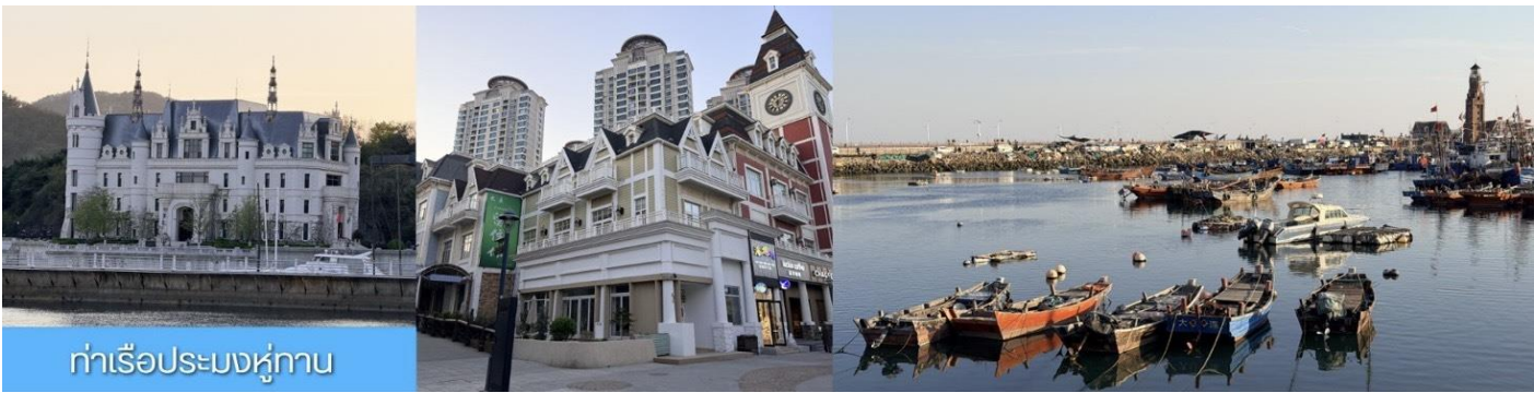
ท่าเรือประมงหู่กาน

พักที่ DALIAN JUZISHUIJING HOTEL หรือ โรงแรมระดับ 4 ดาวท้องถิ่น เมืองต้าเหลียน