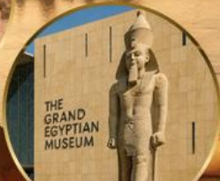
พิพิธภัณฑ์แกรนด์อียิปต์