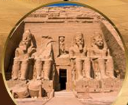
วิหารอาบูซิมเบล