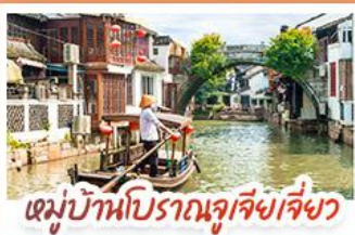
หมู่บ้านโบราณซูเจียงเจี๋ย

สวนสนุกเซี่ยงไฮ้ดิสนีย์แลนด์ เต็มวัน (รวมรถรับ-ส่ง)