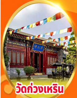
วัดกวางเหริน