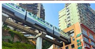
รถไฟทะลุคด