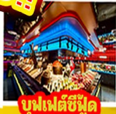
บุฟเฟต์ซีฟู้ด