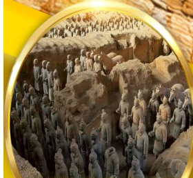
สุสานทหาร ดินเผาจิ๋นซี