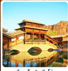
เมืองเล็กตันเสี่ยโซ่ว