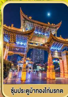
ซุ้มประตูม้าทองไถ่มรดก