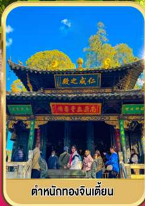
ตำหนักทองจินเตียน