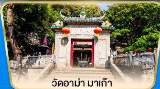
วัดอามา มาเก๊า