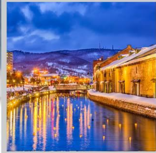
"OTARU CANAL FEST"