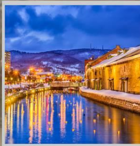
"OTARU CANAL FEST"