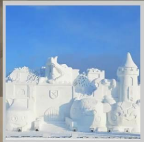
"ASAHIKAWA SNOW FEST"