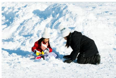
Playing in the snow