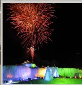
"SOUNKYO ICE FEST"