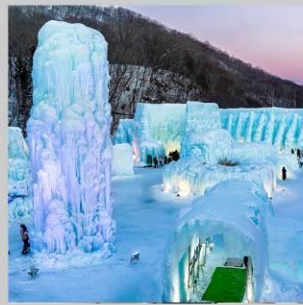
"LAKE SHIKOTSU FEST"