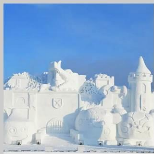
"ASAHIKAWA SNOW FEST"