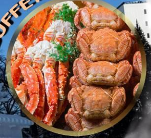
SAPPORO SNOW FESTIVAL 2027