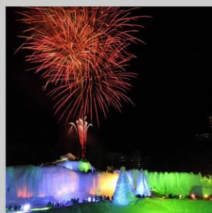
"SOUNKYO ICE FEST"