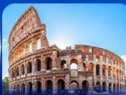
เข็ควินดัง โคโลสซียม โรม