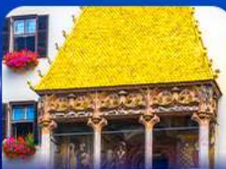
หลังคาทองคำ อินส์บรุค