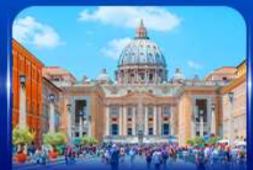
นครรัฐวาติกัน โรม