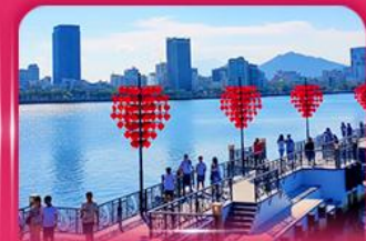
สะพานแห่งความรัก