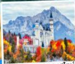
ปราสาทน้อยชวานสไตน์