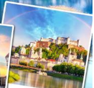
ชาลส์บวร์ก

เที่ยวหมู่บ้านฮิลสติกที่สวยงามที่สุดในโลก เข้าชมความงดงามภายในของปราสาทน้อยชวานสไตน์