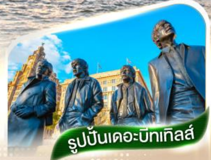
รูปปั้นเดอะบิกเทิลส์

★ตามรอยวงเดอะบิกเทิลส์และสโมสรรีเวอร์พูล★ ณ เมืองลิเวอร์พูล