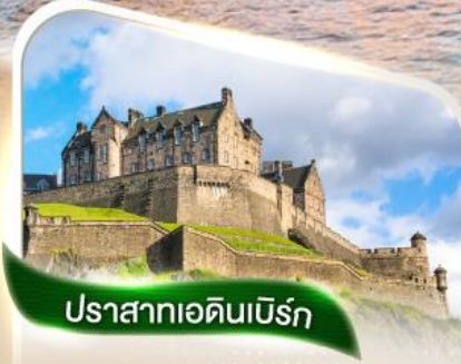
ปราสาทเอดินเบิร์ก