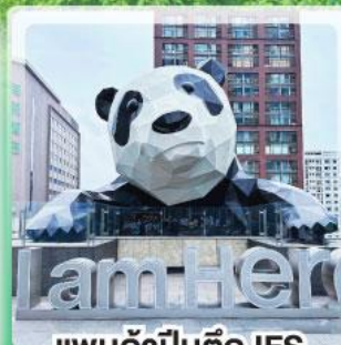
แพนด้าป็นตึก IFS