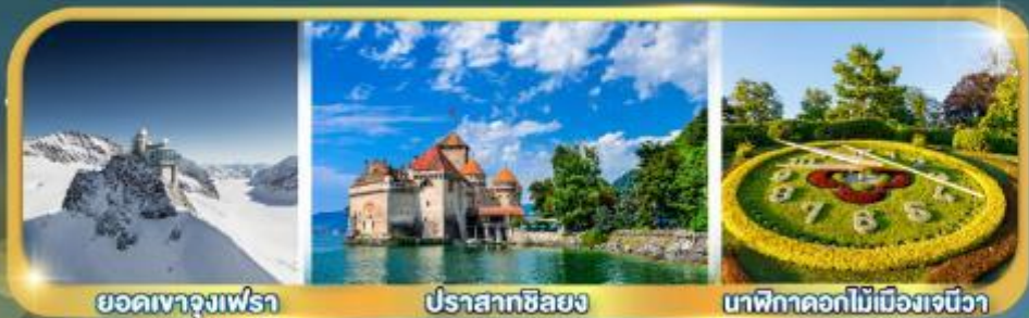
ยอดเขาจุงเฟร่า

กระเช้าไอเกอร์ : ยอดเขาจุงเฟร่า | กระเช้า : ยอดเขาโคลน์แมทเทอร์ฮอร์น กับ ดินแดนห้าหมู่บ้านซิงเกวแตรร์