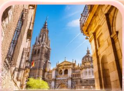
มหาวิหารแห่งโกเอลดา