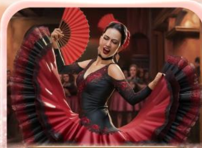
ระบำฟลามิงโก